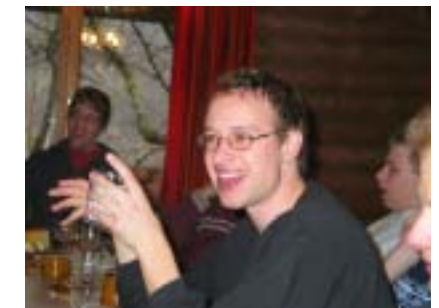
Au dr Basti hets immer luschtig gha.