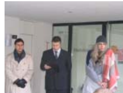
An dr Waldweihnacht hän mr bsuech becho vo denne Persone und hän im Uftrag vo dene em Zunftmeischer miese e Huus baue für e König