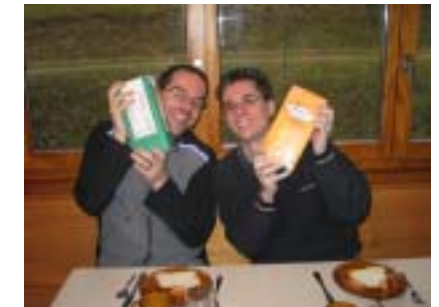
Im Team Weekend hän mrs immer Luschtig, wie me do so schön gseht