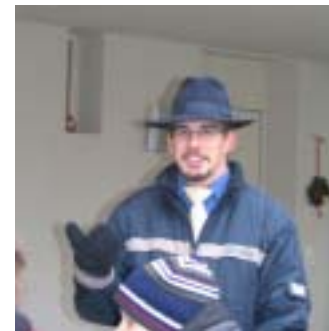
Das isch dä Zunftmeischer gsi...