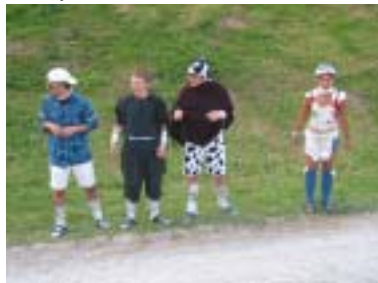
Grad kurz forem Bunte Obe sin mr vo sonige Aliens in beschlag gno worde. Mir hän uns dene miese wehre gege si.