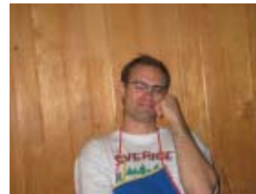
Unsere Koch im Lager. Scho fascht üblich das är immer mitchunt. Är isch eifach dr bescht