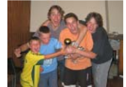
D Sieger im Bunte Obe. Es isch immer wider luschtig z luege wär gwünnt