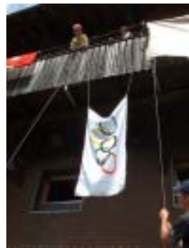
Wie immer hets e Olympiade geh bim beschte Wätter wo me sich wünsche gha