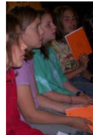
De Bunti Obe bi de Maitli