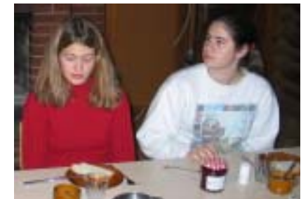
Es hät au Zyt gäh zum sini Gedanke schweife looh