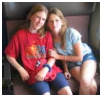
Leider scho wieder uf de Heimreis