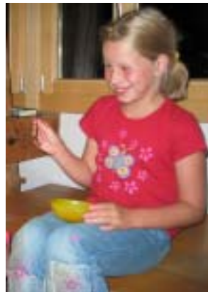
Nachem Bunte Obe hets denne wie immer es Desert geh wo allne gschmeckt het