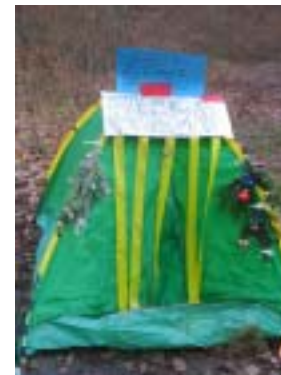
...und das s beschte Huus