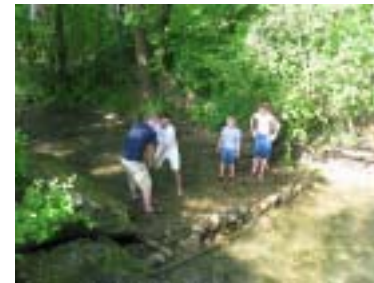
Unseri üblich Freizyt beschäftigung wennis es Bächli het. Pfila