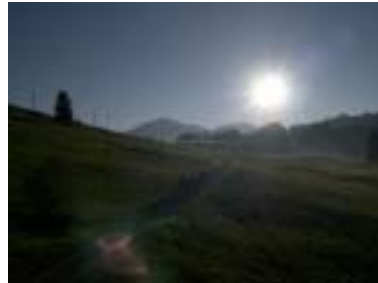
Unser genials Wätter uf dr Tageswanderig ins Schwümbad